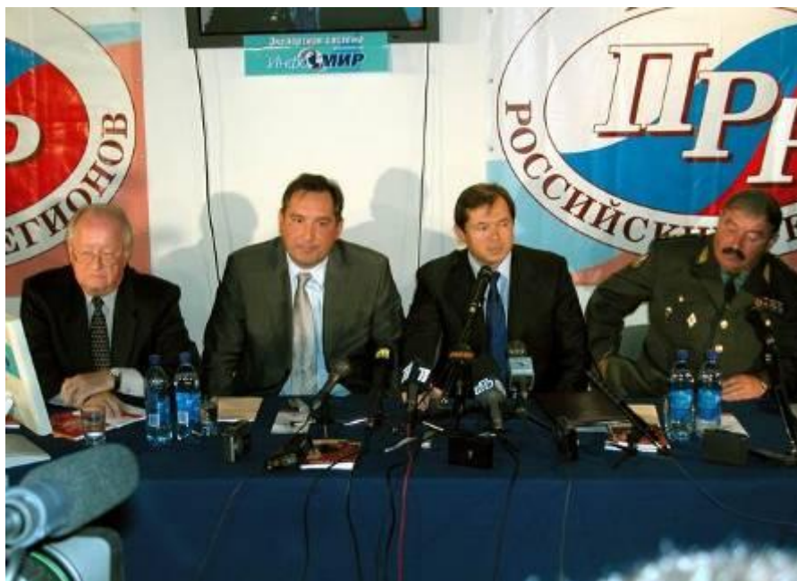
Перед выборами 2003 года на фоне символики Партии российских регионов: Виктор Геращенко, Дмитрий Rogozin, Сергей Глазьев, Георгий Шнак

лидеров зарубежных русских своими посулами, и с 2000 года КРО фактически прекратил существование.