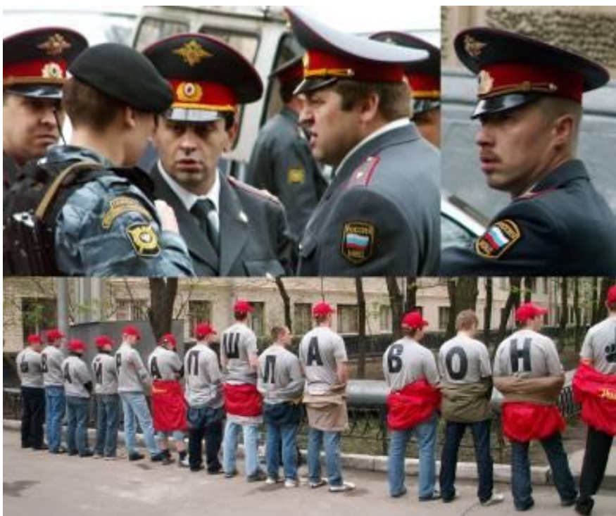
В адресу сфобствующего президента Латвии: "Вайра, пошла вон!". Перед захватом активистов "Родины" отрядом ОМОН, 2005 год

К концу 2004 года партия перешла в жесткую оппозицию Кремлю и была подвергнута политическим репрессиям. В начале 2005 года подконтрольные президенту и правительству средства информации бойкотировали публикацию сведений о голодовке пяти депутатов-членов партии "Родина" в Государственной Думе (протест против разрушения системы социального обеспечения – "монетизации льгот"). Были распространены огульные обвинения партии в сотрудничестве с киевской "оранжевой революцией" и опальными "олигархами" - Ходорковским, Гусинским, Березовским. Также активно распространялись обвинения партии в антисемитизме и нацизме. Никакими доказательствами клеветники себя не утруждали – они действовали по заказу Кремля, отработывая задание по дискредитации "Родины".