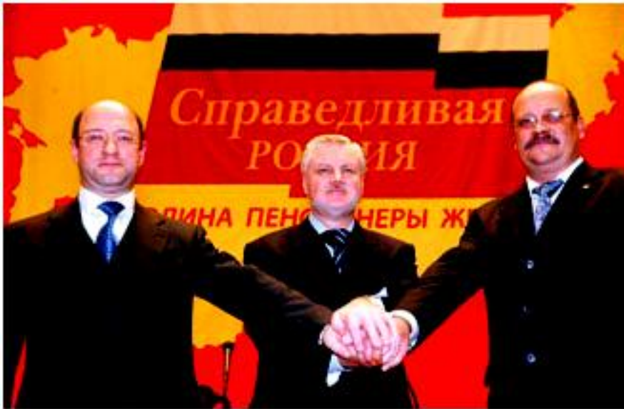
«Жиропенсы» (Жизнь-Родина-Пенсионеры): сговор на костях «Родины»

Можно сказать, что в "Родине" Россия потеряла реальную альтернативу тому гибельному пути, с которого не смогла сойти. Путин уже тогда был невменяем: ему невозможно ничего доказать, урезонить его и снабдить стратегическим видением ситуации. Страхи, которые обычно испытывают самозванцы, одолели его.