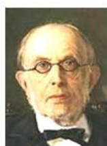
Константин Победо- носцев