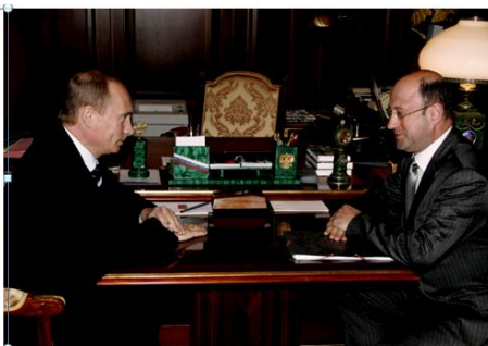
Сепаратная сделка с Путиным