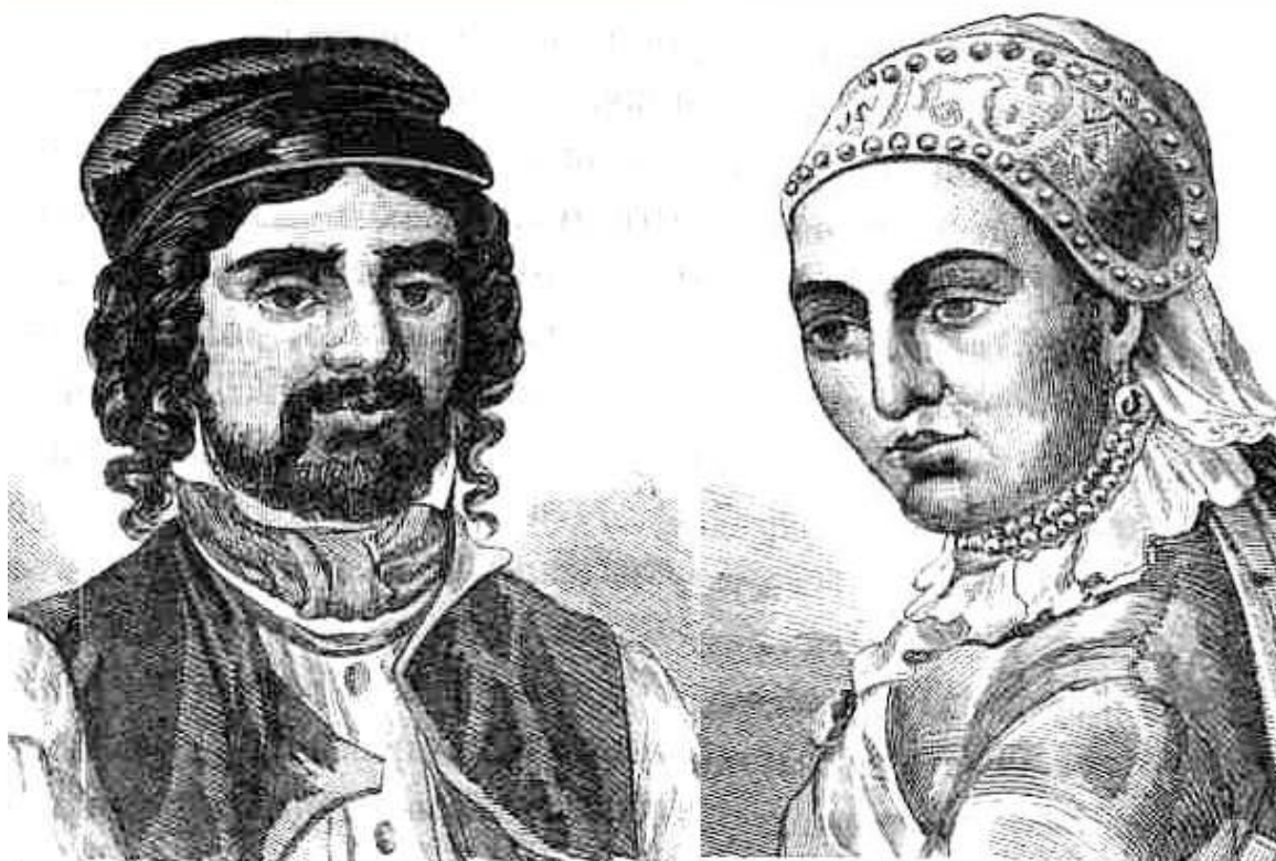
Евреи польских губерний Российской Империи