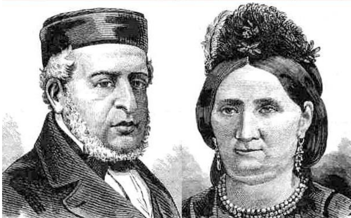
Евреи западных губерний Российской Империи

Если расовые признаки не совпадают с племенными или национальными, то это вовсе не значит, что племен и национальностей (этносов) не существует. Это лишь говорит о том, что расовые признаки в рамках племени и национальности имеют