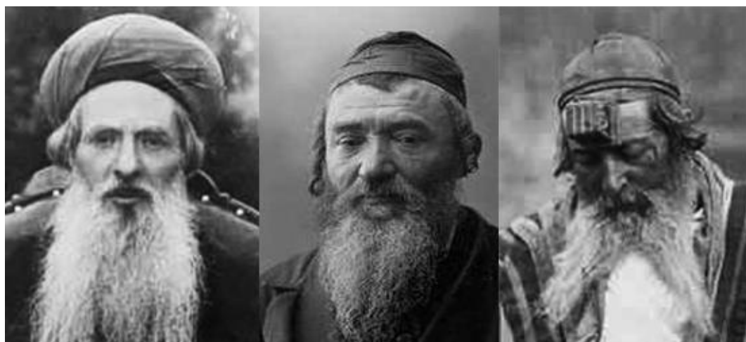
Фотографии 1880-1890. Крымский, кишиневский, херсонский еврей.

Что это за текст? Это не физическая антропология. Это почти что политическая программа: нужно "точным знанием" (точнее мифом о точности и знании) разрушить сначала то, что осталось от традиции, а потом постмодернистским смешением всего со всем убить и это знание. Чтобы в мире не осталось ничего "точного" - ни традиции, ни знания. Как ни странно, сквозь разнообразные по стилю и содержанию фрагменты книги просвечивает именно это стремление. И огромный и безвестный труд множества авторов, перечисленных в библиографии, - свидетельство серьезности намерений некоего неизвестного нам сообщества.