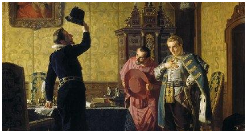
Присяга Лжедмитрия I польскому королю Сигизмунду III на введение в России католицизма (Н.Неверов, 1874)

Самозванец – всегда порождение не только смуты, расстроившей народное самосознание и миссию власти, но и внешних сил, которые используют самозванство как ложный притягательный символ, побуждающих служить этим силам. Литва, Польша, католический Рим лелеяли мечты поставить Русь под свой контроль, провести в жизнь собственные имперские проекты, превратить русские земли в свою периферию.