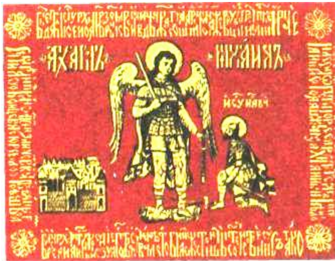
Стяг князя Дмитрия Пожарского

Поход ополчения на Москву в ноябре 1612 года был успешен: поляки были изгнаны. Василий Шуйский к тому времени умер в Польше, патриарх Гермоген был замучен голодом в польских застенках в Москве. Казалось бы, у Пожарского были все основания взять на себя ответственность за страну и, следуя путем Годунова и Шуйского, принудить знать и священство провозгласить его новым царем. Но в таком случае смута продолжилась бы.