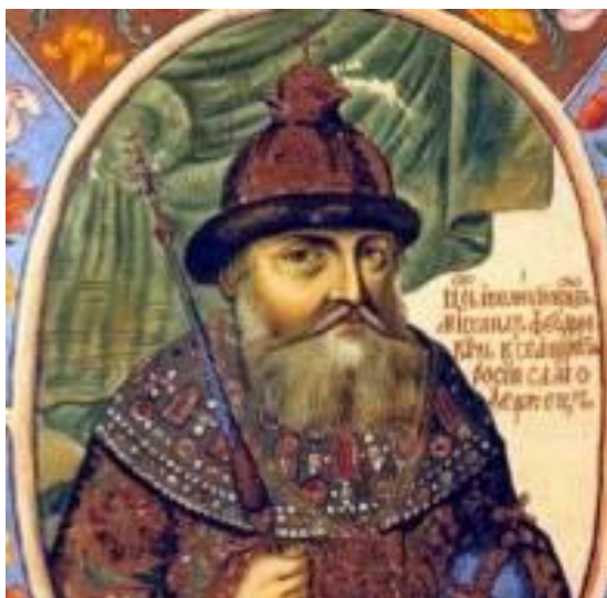
Царь Михаил Федорович Романов

Избрание в марте 1613 года царем не причастного к борьбе за власть шестнадцатилетнего Михаила Романова разрешило все споры о власти. Фигура молодого царя символизировала освобождение от самозванства и смертельных схваток за власть между боярскими группировками, а также прощение взаимных обид между ними.