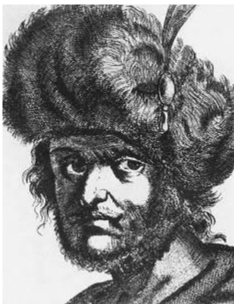
Лжедмитрий II Тушинский вор

Калужский лагерь самозванца между тем начал рассыпаться: искавшее власти и богатства дворянство вновь стало перебираться в Москву, пополняя пропольскую «партию». Самозванец был убит во время охоты ногайским князем. Но вслед претензии на престол были предъявлены новым самозванцем Лжедмитрием III, сумевшим захватить Псков, а также сыном Лжедмитрия II, которому присягнули города Рязанской земли.