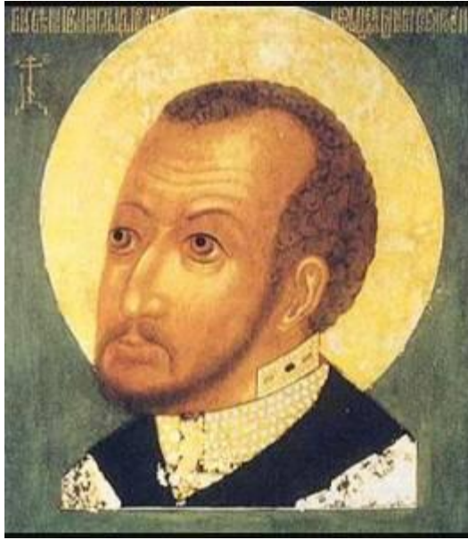
Царь Федор Иоаннович

При всей внешней незаметности Федора Иоанновича - особенно на фоне Бориса Годунова, реальной распоряжавшегося всеми делами государства – именно он был гарантом единения народа и власти. Только при таком единении были возможны масштабные деяния Годунова: учреждение патриаршества, строительство городов и крепостей в Диком поле (Воронеж, Ливны, Белгород, Самара, Царицын, Саратов, Томск), восстановление опустевших после ордынского ига земель к югу от Рязани, успешная русско-шведская война и возвращение ряда русских земель и городов, строительство смоленской крепостной стены, Белого города в Москве, отражение нашествия в 1591 набега крымского хана Казы-Гирея.