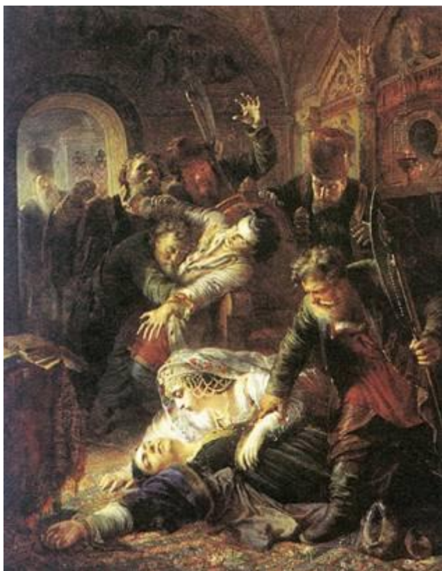
Агенты Дмитрия Самозванца убивают сына Бориса Годунова (К.Маковский, 1862)

В своем бегстве самозванец явно пользовался помощью противников Годунова. Есть основания полагать, что Отрепьев был лично знаком с патриархом Иовом и многими из думных бояр. Что Григорий готовился быть не только монахом, свидетельствует его умение ездить верхом и владеть саблей, а также европейская образованность. Смелость самозванца предопределялась уверенностью в поддержке антигодуновских сил и личном гипнотическом воздействии на толпу.