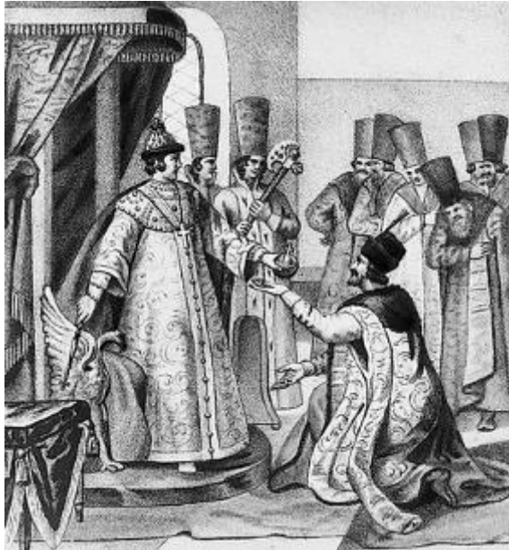
Царь Федор провозглашает Бориса Годунова правителем России

Царь Борис и сам понимал, что по знатности рода с ним могут соперничать Мстиславские, Шуйские и другие известные боярские фамилии, а потому всячески препятствовал их влиянию. По доносу он сослал и постриг в монахи Федора Романова и его жену. (Что и предопределило негативное отношение к Годунову в официальной историографии романовских времен). К концу своего правления Годунов заперся в кремлевских палатах, отказался принимать челобитные и потребовал, чтобы в каждой семье читалась особая молитва и поднималась заздравная чаша за царя. Подобное навязывание лояльности не могло не вызвать недовольства, переходящего в ненависть.