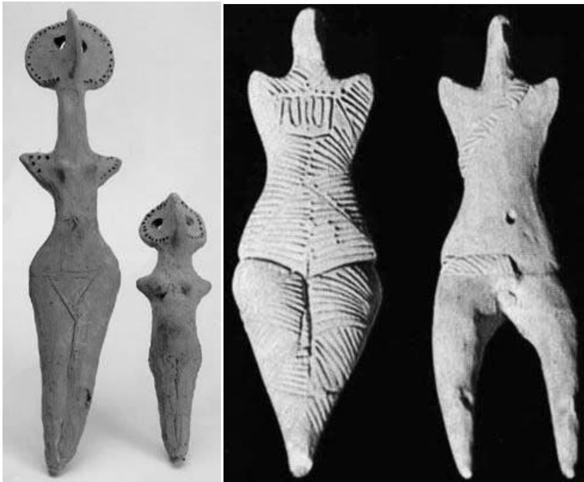
Идолы культуры Кукутень-Триполье

Свидетельство древнейших миграций - сходство женских фигурок трипольской культуры с образцами таких же фигурок более позднего происхождения, найденных на Кипре и в Ливане.