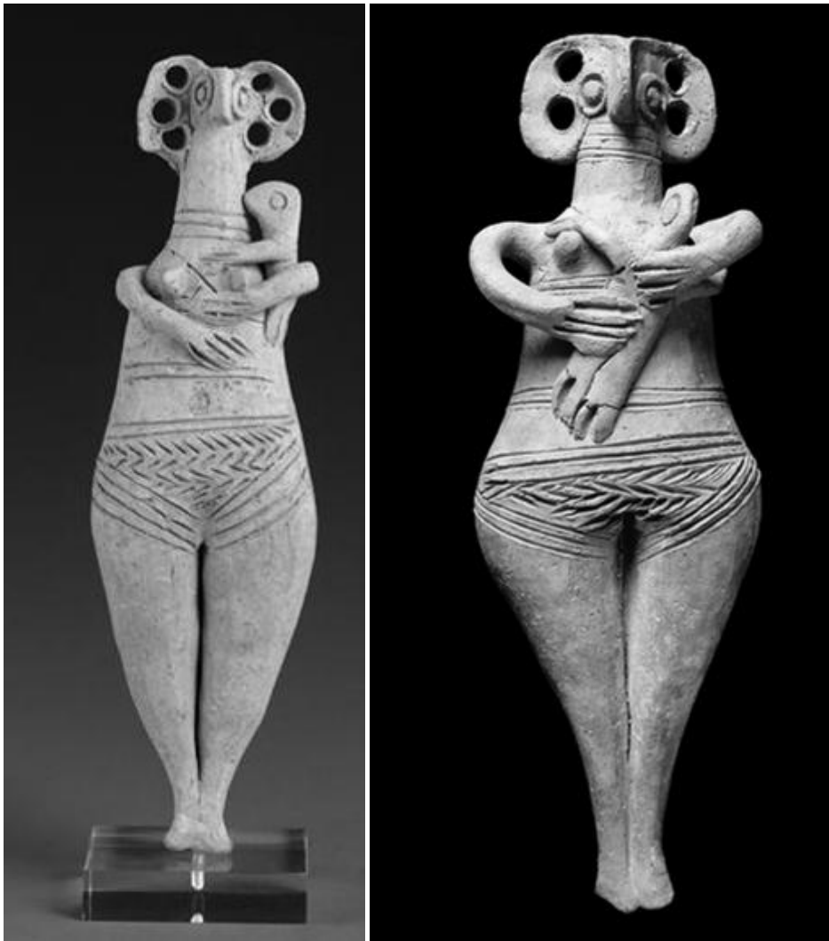
Ливанский идол, 1600-1100 гг. до н.э., Лувр, Париж Кипрский идол 1450-1200 гг. до н.э., Британский музей, Лондон