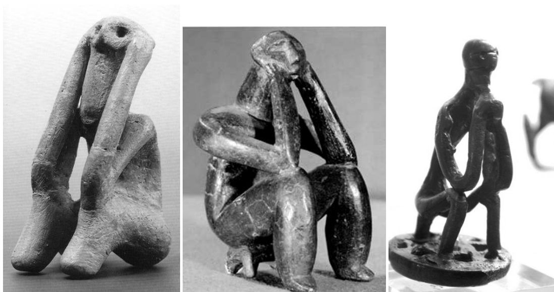
Кукутень-Трипольский "мыслитель", Чернаводский "мыслитель", спартанский "мыслитель"

Считается, что трипольская культура исчерпалась в середине III тыс. до н.э. Но это исчерпание может быть связано пусть и с не очень-то стремительной, но массовой миграцией, характерной для населения этих земель в последующие эпохи. Поскольку во Фракии мы встречаем очень сходные с трипольскими укрепленные поселения, курганные захоронения, каменные топоры-молоты, орнаменты на керамике в виде насечек и налепов, мы можем предположить миграцию трипольцев именно на фракийские земли. Даже трипольские деревянные серпы с режущими каменными вставками по форме напоминают дакийские мечи. То, что считается одновременным присутствием трипольцев на протяженной территории, вполне может быть миграционным следом, который теряется во фракийских землях.