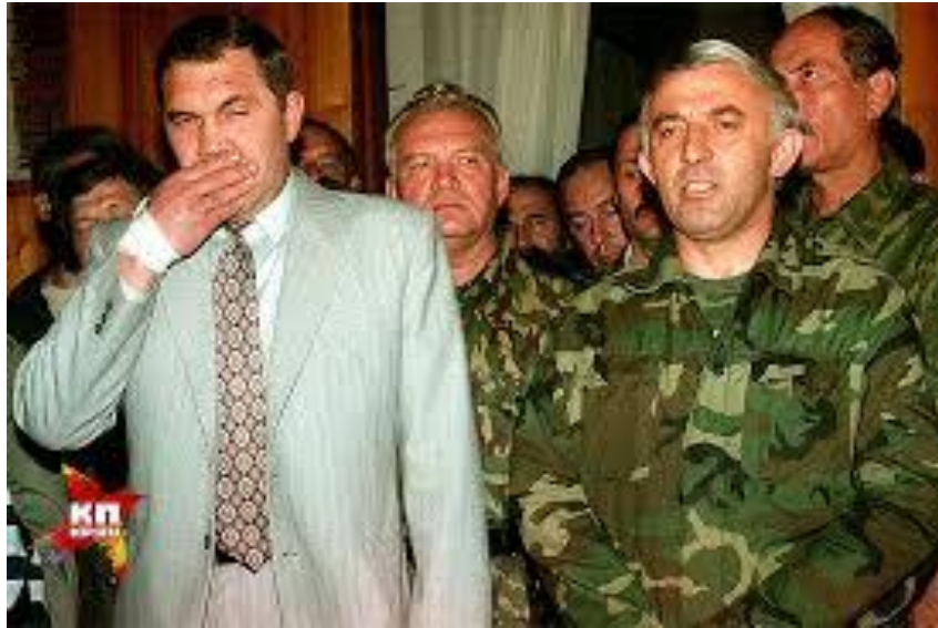
А вот и предательская экзема

По сути дела, вся биография Лебеда укладывается в сюжет: прилетел-обворожил, спел свою песню и улетел, оставив пепелище. Улетел, потому что в очередной раз кто-то оказался виноват, что в жизни все обернулось не так, как в «лебединой песне». Отсюда вытекает и тотальная лживость, ставшая отпечатком мифологического лебеда на судьбе человека с «говорящей» фамилией.