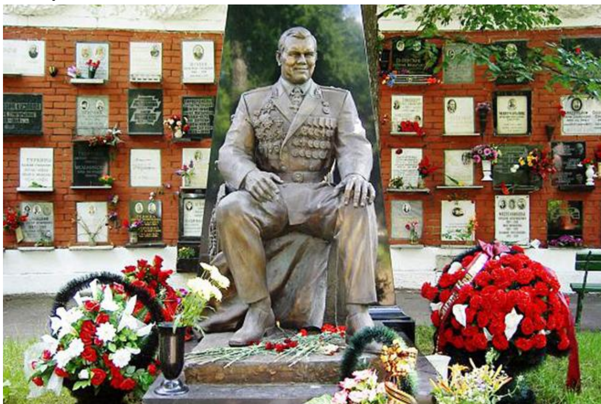
Ужасный в своей нелепости памятник Александру Лебедю на Новодевичьем кладбище в Москве