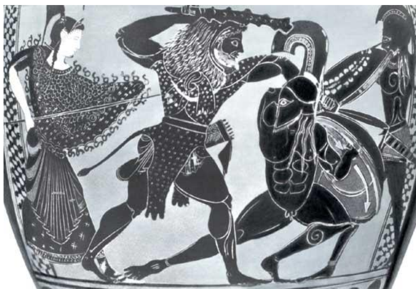
Битва Керакла с Кикном. В руках в Геракла традиционная дубина. Афина выступает на его стороне. Вазопись ок. 510 г. до н.э., Музеи Ватикана.

Есть еще два сюжета: Кикн – друг Фаэтона, оплакивавший его смерть столь жалобно, что Аполлон превращает его в лебедя и помещает на звездное небо; Кикн – один из женихов Пенелопы, которых убивает Одиссей.